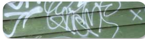
Standaard bescherming tegen vandalisme en graffiti.

Trigoon Plus biedt standaard een bescherming tegen vandalisme en de daaruit voortvloeiende schade. En ja, ook een poging tot diefstal beschouwt Fidea als vandalisme. Opnieuw zonder vergoedingslimiet.